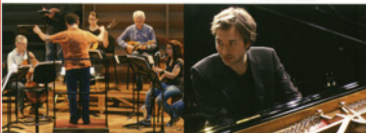
Ensemble "Arrigo Boito"

Mercoledì 11 aprile ore 20.30 Oratorio San Filippo Neri